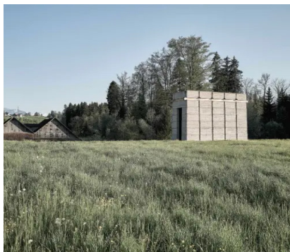
Ziegelei Museum, Ofenturm aus Stampflehm

Update 3.4.2026, Ria Saxer, Lengsfeld, Christine Renold