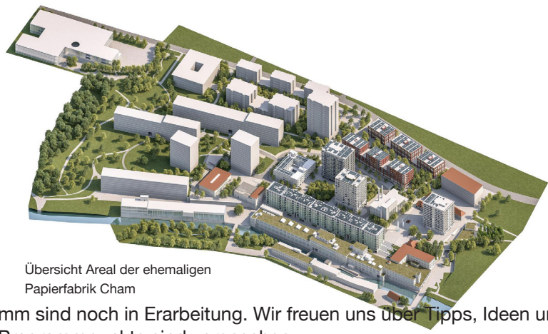
Übersicht Areal der ehemaligen Papierfabrik Cham