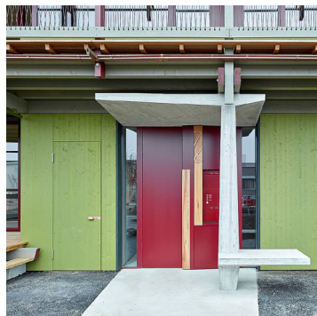
Wohnüberbauung Moos-Cham von Lölinger Strub Architekten