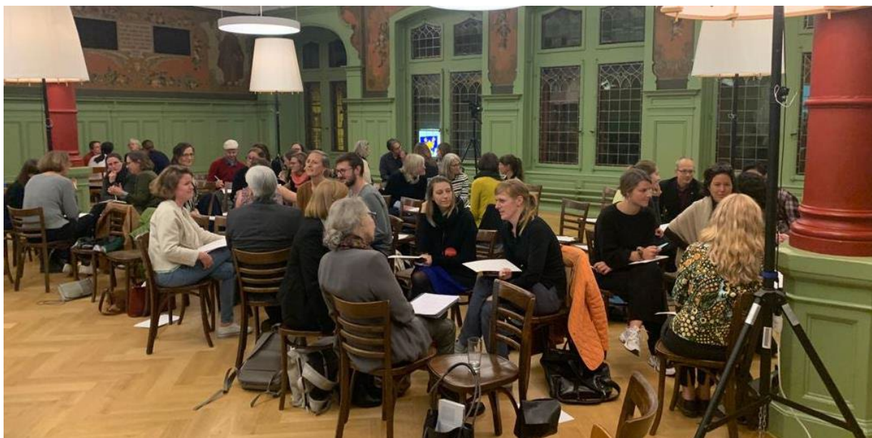
Dialogveranstaltung «Städtebau für eine fürsorgliche Gesellschaft», Basel

Le format du film-portrait (Katharina Marchal et Veronika Selig) d'une construction, développé pendant la pandémie, a trouvé son prolongement avec 2 films réalisés : « Gesundheitskasse EGK » de Flubacher Nyffeler Architekten et « Genossenschaftsbau im Wettsteinquartier » de jessenvollenweider architektur. Pour des raisons budgétaires, ce format n'aura malheureusement pas de suite en 2023 et la série sera arrêtée.