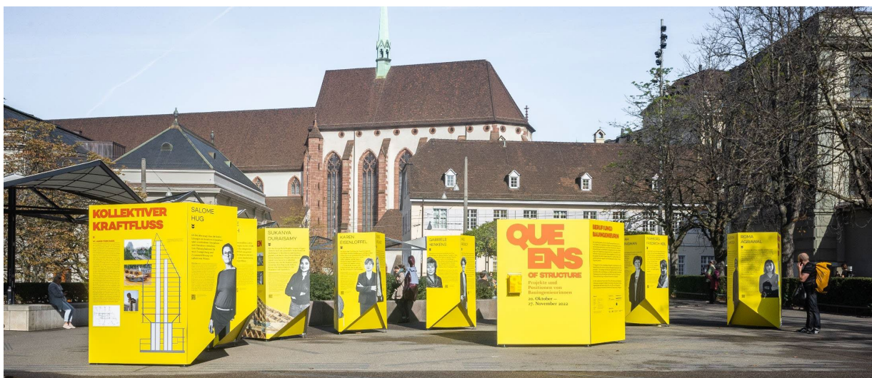
"Queens of Structure" Ausstellung Theaterplatz Basel