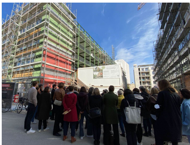
Baustellenführung Basel

Pour le développement de notre groupe régional, un atelier est prévu en janvier 2023, dans le cadre duquel l'orientation, les formats, la participation et le potentiel de notre réseau seront traités. Les formats établis tels que les rencontres Lunchtime ou les visites guidées seront maintenus.