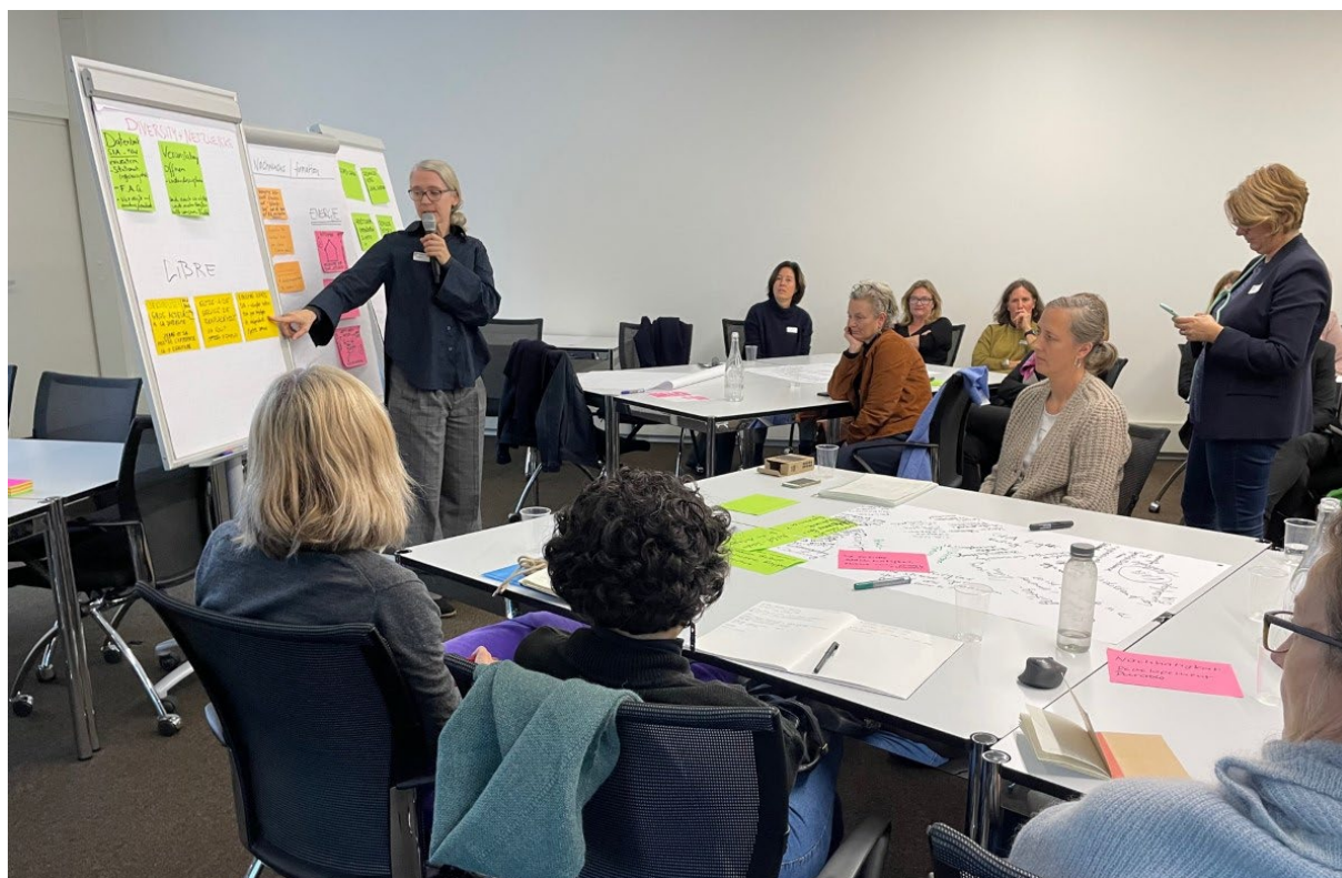
Clôture de l'atelier le 11.11.2022 à Genève.

Les résultats des discussions sont à la disposition des groupes régionaux et au niveau national pour orienter et stimuler les activités en 2023. Le comité reprendra les résultats lors de sa première réunion en 2023 et en discutera pour les activités des départements.