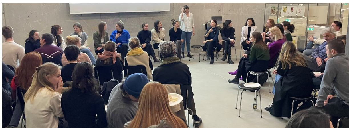
Evènement "SIA-Meisterin" RG Zürich

Pour clôturer l'année, le nouveau format « SIA-Meisterin » (championne SIA) a été lancé le 7 décembre 2022 : La SIA désigne chaque année des projets de fin d'études des hautes écoles dans le domaine de l'architecture pour le prix « SIA Meisterin ». Afin d'augmenter la visibilité des travaux des femmes diplômées et de leur offrir une plateforme publique, toutes les femmes nominées ont été invitées à présenter leur travail à Zurich.