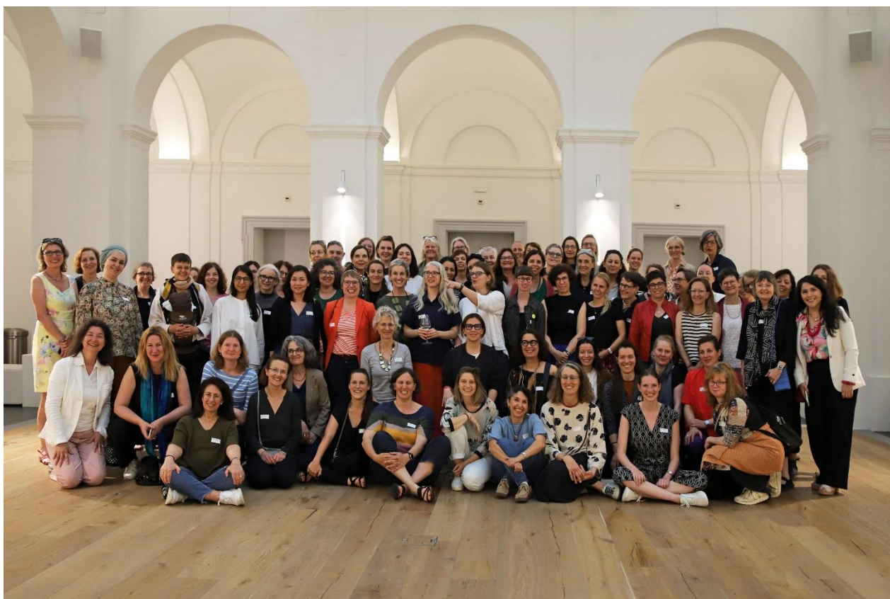
Festa con membri della rete e ospiti nell'Asilo Ciani.

Dopo l'assemblea generale, il gruppo regionale Ticino ha organizzato una visita a Villa Saroli. In serata, presso l'Asilo Ciani, è la volta della conferenza e dei festeggiamenti per il 20° anniversario.